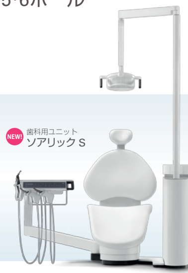
NEW! 歯科用ユニット ソアリック S