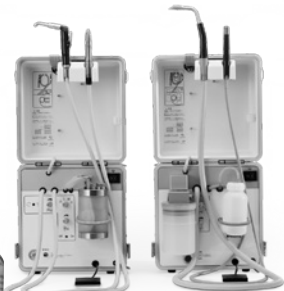
ポータブル診療ユニット ポータキューブ