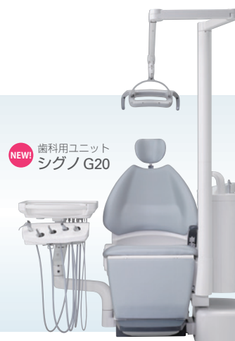
NEW! 歯科用ユニット シグノ G20