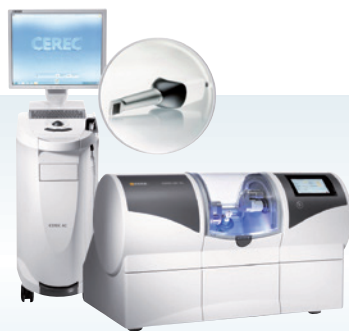
チェアサイド型歯科用コンピュータ 支援設計・製造ユニット セリック AC オムニカム