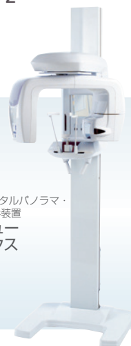
歯科用デジタルパノラマ・ CTX線撮影装置 ペラビュー エポックス 3Df α