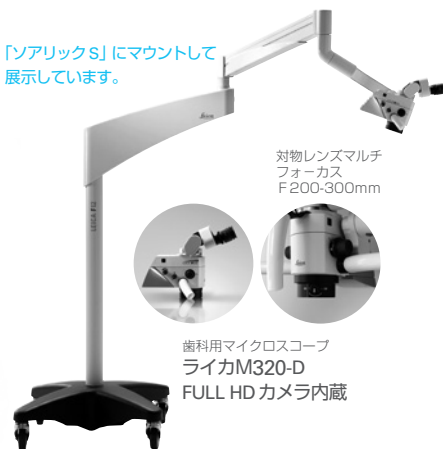
対物レンズマルチ フォーカス F200-300mm