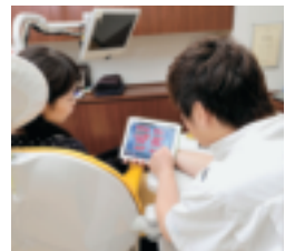
ウェブサイトを見た患者さんが来院すると、MedVisor Dental for iPadを用いて治療説明を行う。

メーションのビジュアル・インパクトこそ、MedVisor Dental for Webとfor iPadを使用する魅力ではないでしょうか。