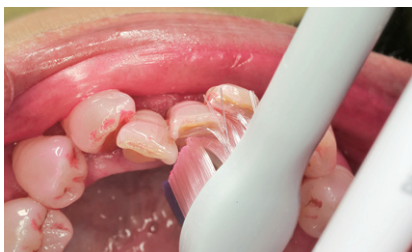
図3 複雑な歯列の舌側面はブラシを縦に挿入し、プラーク除去。