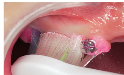
図6 ブラケット周囲にもうまくフィットするため、プラークが除去しやすい。