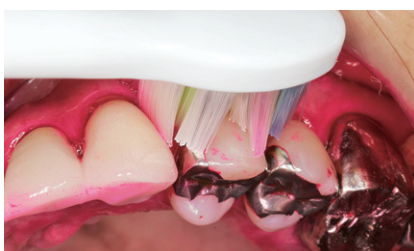
図8 ブラッシングが難しい左上3番、4番のカーブにも適正にブラシを当てることできる。