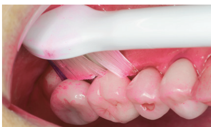
図7 インプラントの上部構造でもマージン部までアプローチしやすい。