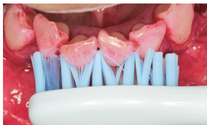
図1 歯列不正の歯頸部、隣接面にブラシを当てている様子。

当院では診療の質の向上や均一化のために、さまざまな作業をマニュアル化しています。それはソニックアーの指導方法についても同様で、持ち方やブラシの当て方、患者さんへの指導方法などについて、キャリアの有無にかかわらずスタッフ全員が同じ説明を行うためのマニュアルを作成しています。