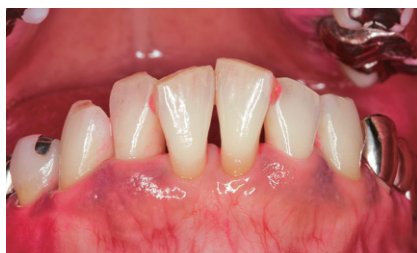
図2 適正にソニックアーを当てたことでプラークが除去できている。