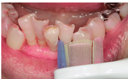
図4 ホワイトプラスコンパクトはヘッドが小さいので、叢生部位にも当てやすい。