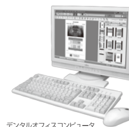
デンタルオフィスコンピュータ DOC-5 プロキオン (SOAP・レセ電対応) 患者プレゼンテーションソフト トリネティコア プロ