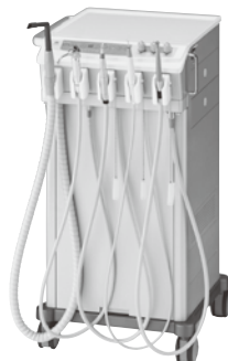
可搬式歯科用ユニット ユーティリオ