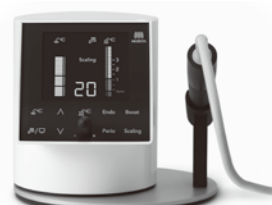
NEW! 歯科用多目的超音波治療器 ソルフィーフ