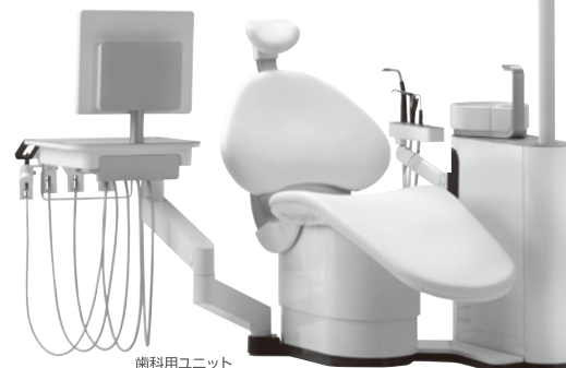
歯科用ユニット ソアリック