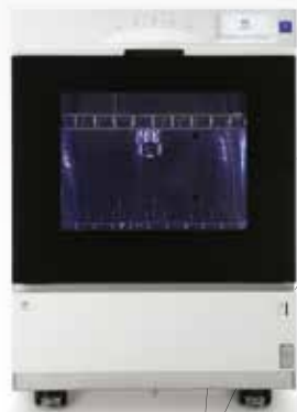
NEW! 器具除染用洗浄器 WD-150 ウォッシャー・ディスインフェクター

ツインパワータービン ゼロサックバック 体験コーナーを 設けていますので ぜひ、モリタブースへ お立ち寄りください!