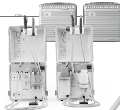
NEW! ポータブル診療ユニット ポータキューブ