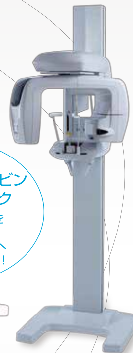
NEW! 歯科用デジタルパノラマ・CT X線撮影装置 ペラビューエポックス 3Df