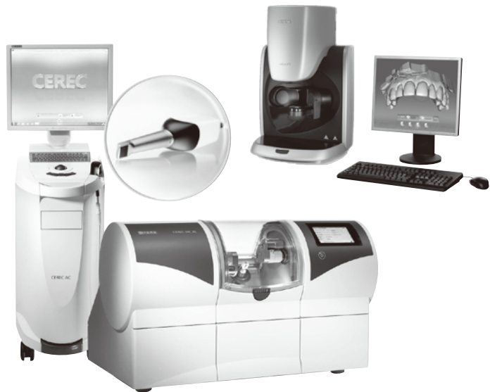
NEW! チェアサイド型歯科用コンピュータ支援設計・製造ユニット セラック AC オムニカム

歯科技工室設置型コンピュータ支援設計・製造ユニット in Eos X5 スキャナー PC 付き