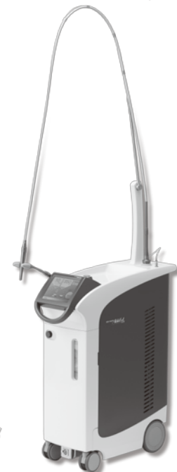
歯科用 Er:YAG レーザー装置 アーウィン アドベール Evo