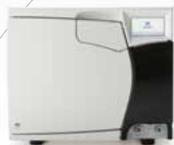
NEW! 小型包装品用高圧蒸気滅菌器 BC-17 プレポストバキューム式オートクレーブ