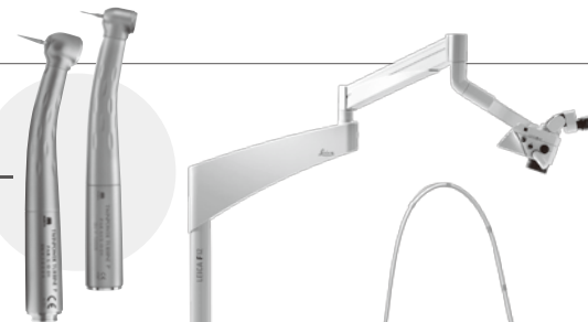
歯科用マイクロスコープ ライカ M320 F12-D