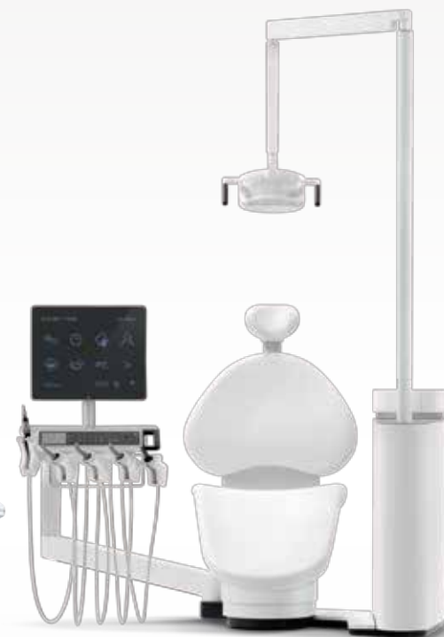
歯科用ユニット ゾナリック