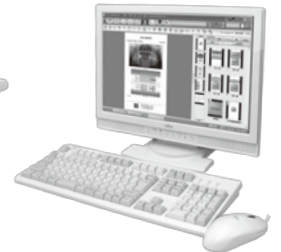
患者プレゼンテーションソフト トリニティコア プロ