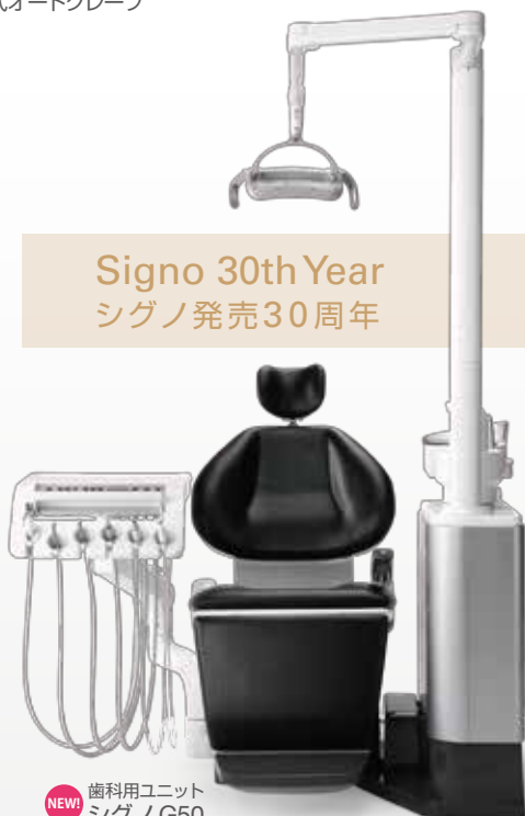
Signo 30th Year シグノ発売30周年