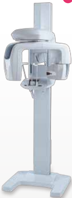
NEW! 歯科用デジタルパノラマ・CT X線撮影装置 ベラビューエボックス 3Df 40e