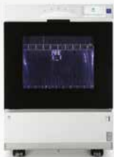
NEW! 器具除染用洗浄器 WD-150 ウォッシャー ディスインフェクター

〒812-0031 福岡県福岡市博多区沖浜町7-1 (JR博多駅からバス約18分)