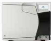
NEW! 小型包装品用高圧蒸気滅菌器 BC-17 プレポストバキューム式オートクレーブ