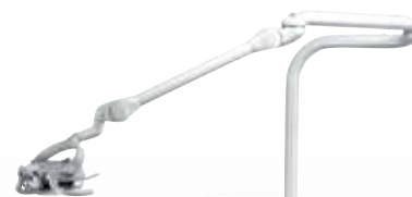
Spaceline 50th Year スペースライン発売50周年