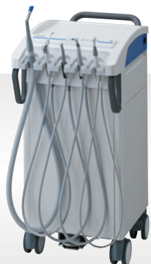
NEW! 可搬式歯科用ユニット ユーティリオII