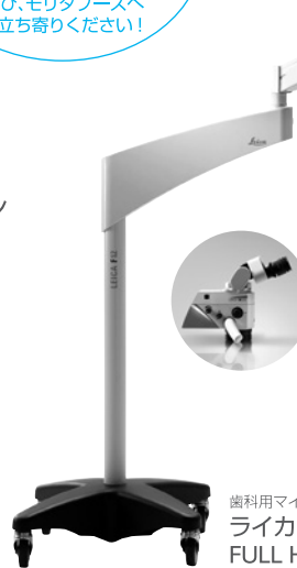
歯科用マイクロスコープ ライカM320-D FULL HDカメラ内蔵