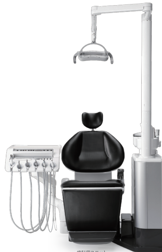
歯科用ユニット シグノ G50