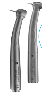
歯科用ガス圧式ハンドピース ツインパワータービン

ツインパワータービン ゼロサックバック 体験コーナーを 設けていますので ぜひ、モリタブースへ お立ち寄りください!