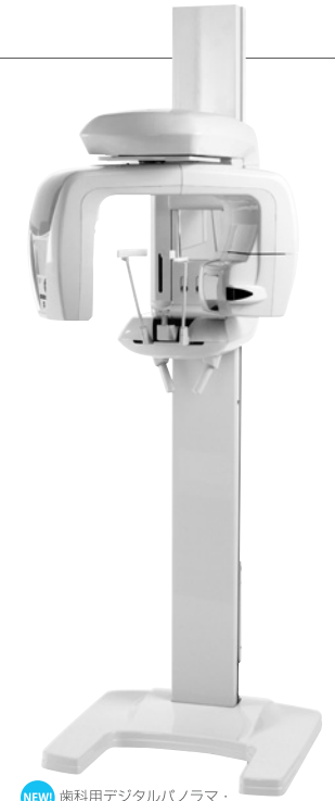
NEW! 歯科用デジタルパノラマ・ CTX線撮影装置 ベラビュー エポックス 3Df α