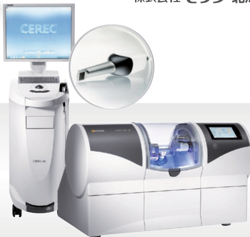
チェアサイド型歯科用コンピュータ 支援設計・製造ユニット セラック AC オムニカム