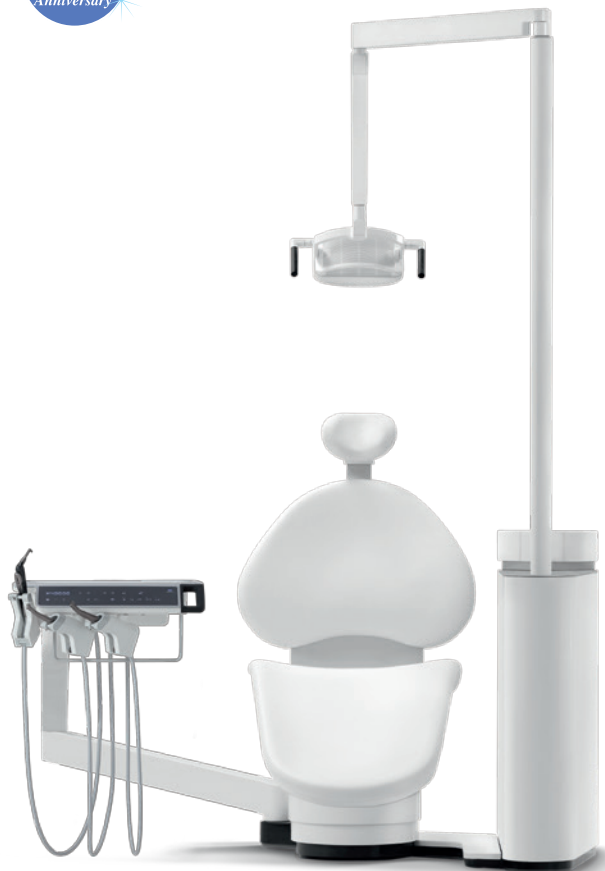
NEW! 歯科用ユニット ソアリック S