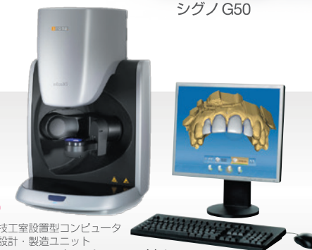
NEW! 歯科技工室設置型コンピュータ 支援設計・製造ユニット in Eos X5 スキャナー PC 付き