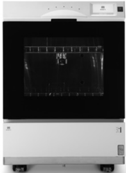
器具除染用洗浄器 WD-150 ウォッシャー・ディスインフェクター